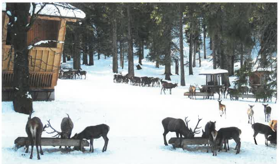
Rotwildfütterung bei der Agrargemeinschaft Nenzing.